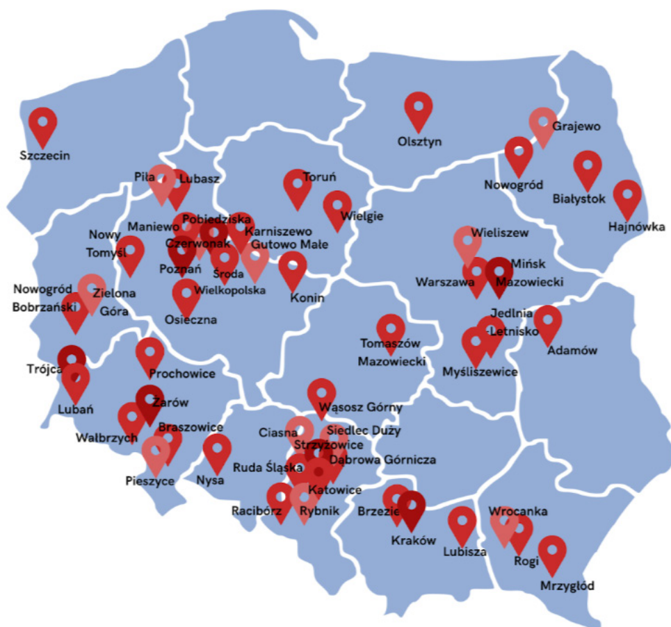
Rysunek 1. Mapa przedstawiająca lokalizację szkół, skąd przysłano zgłoszenia na konkurs Dbamy o klimat w szkole .

Pomysł na konkurs Dbamy o klimat w szkole zrodził się w ramach Think Tanku SOS dla Edukacji w obszarze Dobry klimat i dobre relacje . Został ogłoszony w październiku 2025 roku i był skierowany do nauczycieli i nauczycielek szkół podstawowych oraz ponadpodstawowych z całej Polski. Celem konkursu było wyłonienie i upowszechnienie przykładów dobrych praktyk nauczycielskich, które realnie wpływają na budowanie pozytywnego klimatu w szkole. Idea konkursu było pokazanie, że codzienne działania nauczycieli i nauczycielek w sali lekcyjnej, jak i poza nią, mogą tworzyć przestrzeń współpracy, wzajemnego wsparcia i zaufania. Dobre praktyki sprawiają, że nauka staje się skuteczna i przyjazna. To pomysły, które budują relacje, wspierają rozwój uczniów i uczennic oraz tworzą pozytywną atmosferę w szkole. Każda taka mikrostrategia to przykład, jak nauczyciel lub nauczycielka może codziennie wpływać na lepszy klimat w szkole. W tegorocznej edycji otrzymaliśmy aż 67 zgłoszeń z całej Polski .